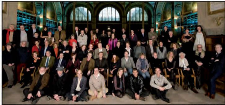
Photo des écrivains à la BnF Richelieu à l'occasion des 10 ans de Lire et faire lire (2010)